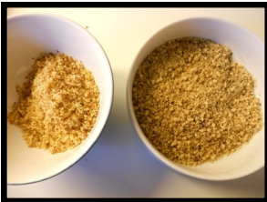
og hakket igen (mel til boller).

så blev der pillet (det tog meget lang tid)