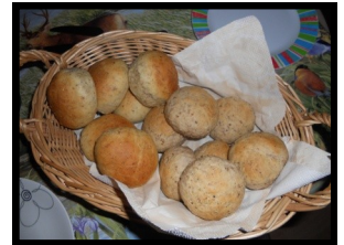
og lækre boller