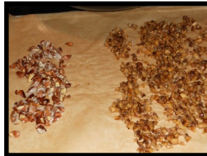
Så kom der sukker-ristede bog og agern