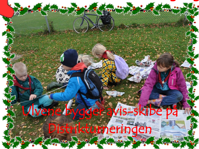
Ulvne bygger avis-skibe på Distriktturneringen