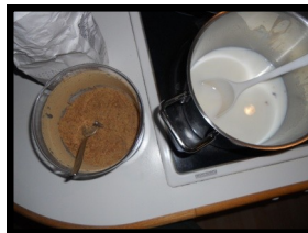
og varm "kakao" af ristede finthakkede agern.

Til sidst kunne vi sætte os til et veldækket bord (dog mangler småkager med bog, dem skal vi have til næste klanmøde)